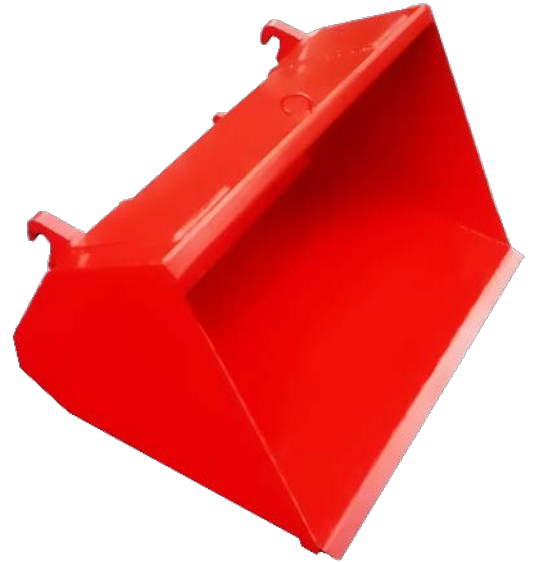
Abb.: Industrie Frontlader Erdschaufel 1,25