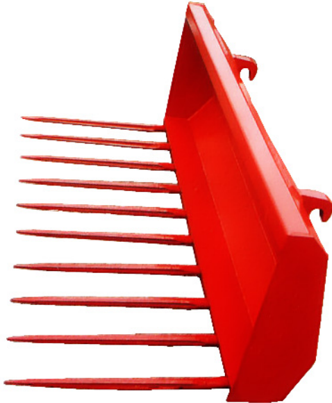
Abb.: Industrie-Frontladergabel 1,7 m breit