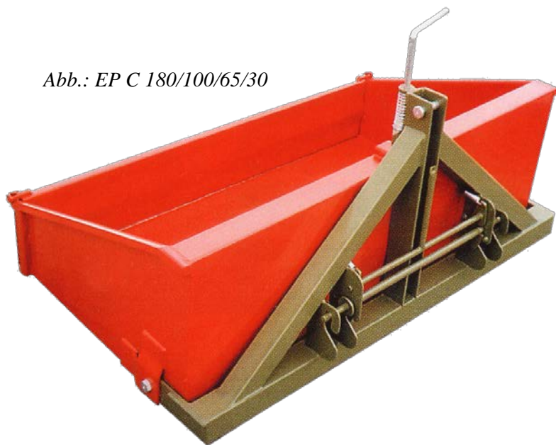
Abb.: EP C 180/100/65/30