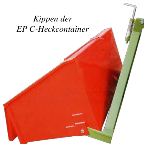
Kippen der EP C-Heckcontainer