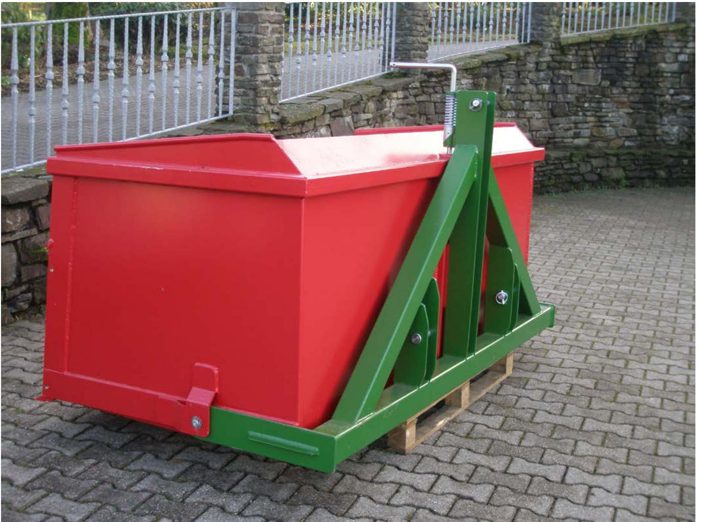
Abb.: EP HC 220/100/100/50