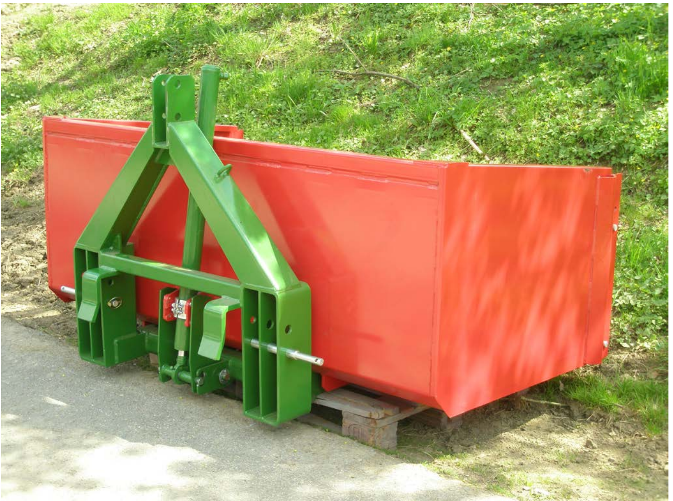
Abb.: EP h.C 200/100/70/50